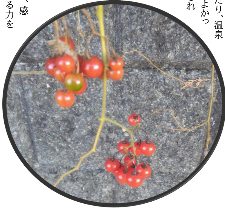
西町でみつけたつる性の植物。赤い実(8mmくらい)がかわいい。