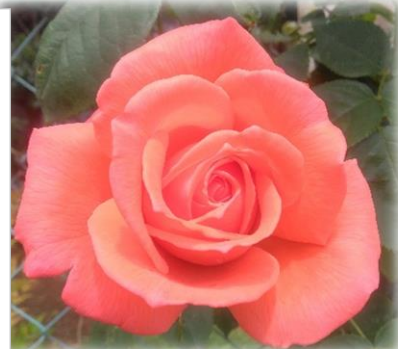
西町の排水路の上の通路に向かって、いつも沢山の花を映かせているお宅があります。この写真も撮らせてもらっています。ダメとは言われませんが…

その猟師さんは熊打ちの名人といわれているとのことでしたが、三十年の猟師生活で、熊をしとめたのは八回とのこと。撮影時にしとめた