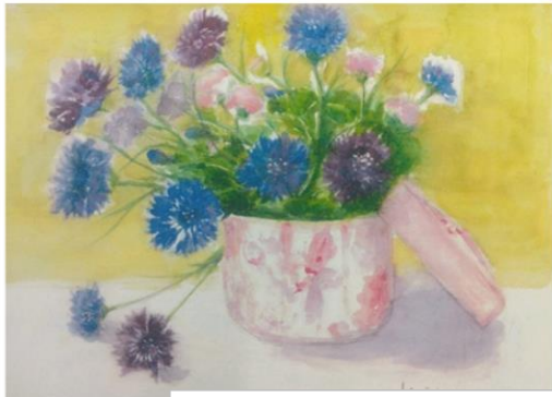
趣味で水彩画をしている方から、応援お葉書いただきました。あんまり素敵なので、掲載させていただきます。

「この日は、愛風で召し上がったご家族が三組ありました。周りに人が沢山居る中での食事、普段はお野菜が苦手という男の子も女の子も、知らないうちに野菜を口に運び、食べちゃいました。」 少子化で一人っ子も多いので、他のご家族と一緒にというお食事場面は特別であるようです。