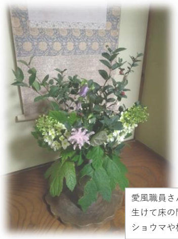
愛風職員さんが、ご自宅で取ってきて生けて床の間に飾ってくれています。ショウマヤや柏葉アジサイとイケてます♡

日本にもやおろすの神様の信仰が各地にあります。季節ごとに決まった儀式も残っていて、厳粛にとりおこなっている人もいらっしやいます。効率化や合理化が是とされる価値観の中では、意義も必要性も見いだせない類のこと、むしろ